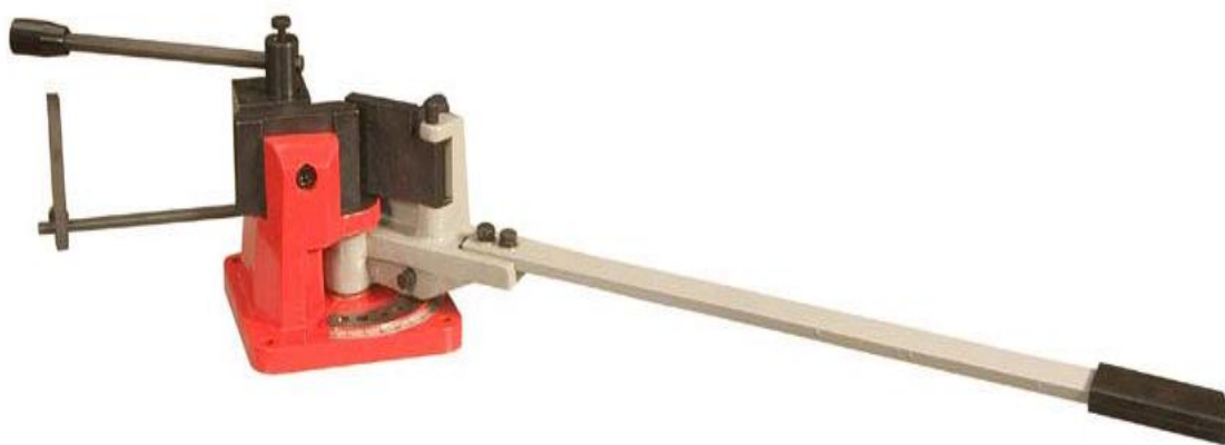
Univerzální ohýbačka UB70, UB100, UB100A